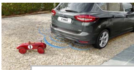
Tipala za pomoč pri parkiranju