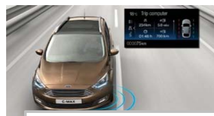
Pomoč pri ohranjanju voznega pasu