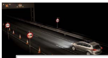
Prepoznavanje prometnih znakov