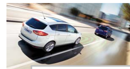
Prilagodljiv radarski tempomat

Stroški prevoza, nultege servisa in priprave vozila