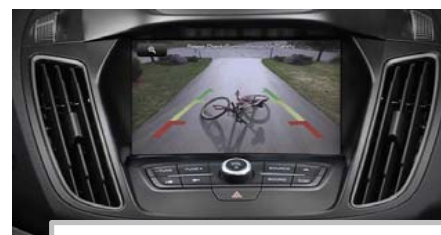
Kamera za pomoč pri vzvratni vožnji