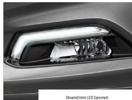
Dinamični LED žarometi