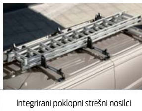
Integrirani poklopni strešni nosilci