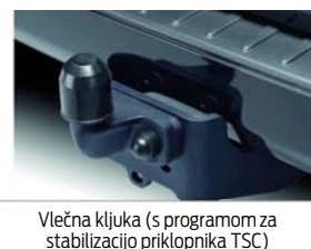
Vlečna kljuka (s programom za stabilizacijo priklopnika TSC)