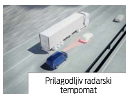
Prilagodljiv radarski tempomat