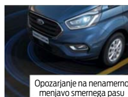
Opozarjanje na nenamerno menjavo smernega pasu