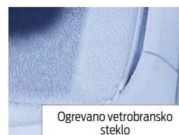
Ogrevano vetrobransko steklo