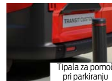
Tipala za pomoč pri parkiranju