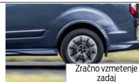
Zračno vzmetenje zadaj