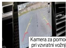
Kamera za pomoč pri vzvratni vožnji